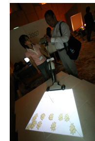
図 1 バーチャルな情報を投影する掃除機。

Mark Weiser は UIST 94 の講演 8) の中で、コンピュータの利用形態が、メインフレームからパーソナルコンピューティングに移行し、21世紀にはさらにユビキタスコンピューティングが主流になると予想した。最初にメインフレーム時代が始まった直後の1950年代初頭から、すでに人々はコンピュータの上で動作するゲームプログラムを作っている。また、