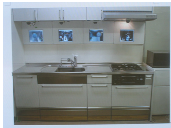
図1 Kitchen of the Future