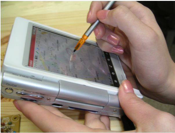
図 2: 上はセンサ (円内) に触れずにドラッグすることでスクロールしているところ, 下はセンサに触れることで手書きメモ入力しているところ。

小型コンピュータは公共の場に携帯されて利用されることも多い。そのため、住所や電話番号など個人情報を記入したり、パスワードを入力するなど、他の人に画面を見られたくない場合もある。そこでプライベートな情報を入力(手がタッチ)している時に、バックライトの照度を下げる等の仕組みを機能させ、のぞき防止用の画面とすることも可能である。